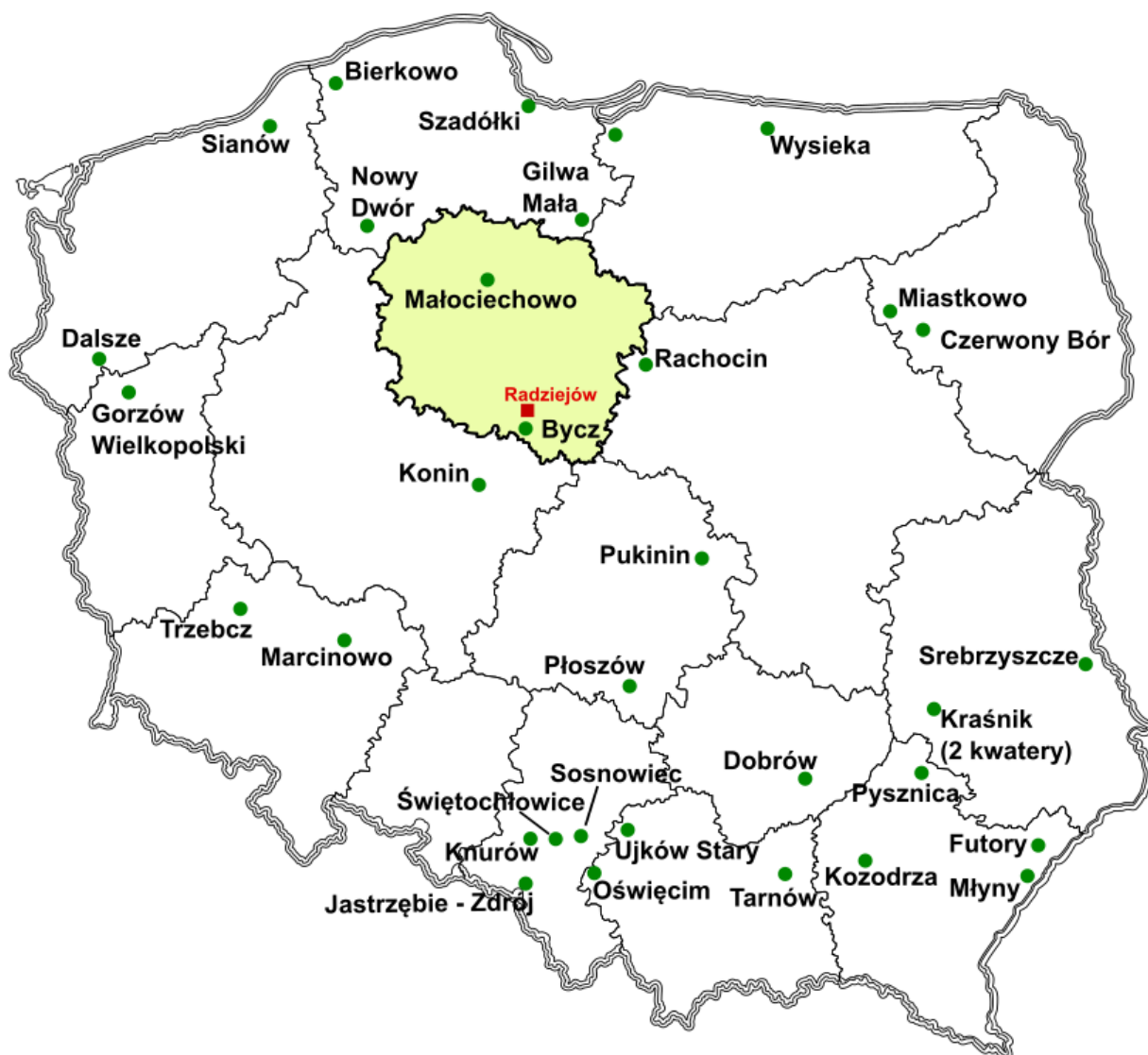
Ryc. 3. Lokalizacja składowisk odpadów zawierających azbest